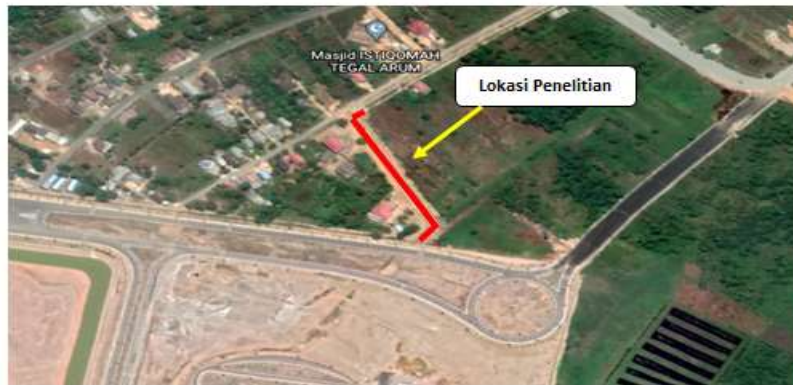
Lokasi Proyek dibelakang Bandara Syamsudin Noor