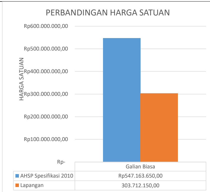
Gambar 4.1 Diagram Batang Perbandingan Harga Satuan Metode AHSP Spesifikasi 2010 dan Analisis Lapangan