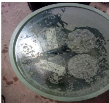
Gambar 3. Perawatan

pada penelitian ini menggunakan air PDAM dan air gambut.