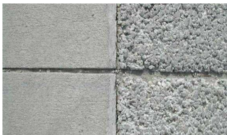
Gambar 1. Perbedaan Tekstur Permukaan Beton Berpori Dengan Beton Normal

perkerasan beton berpori memiliki suhu permukaan yang lebih rendah daripada perkerasan lentur dan juga perkerasan kaku normal dikarenakan luas permukaan penguapan yang ada lebih sedikit. Selain itu tekstur kasar juga membuat permukaan beton berpori menjadi lebih kesat dibandingkan dengan perkerasan normal.