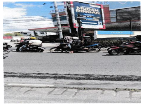
Gambar 2. Lokasi Penelitian