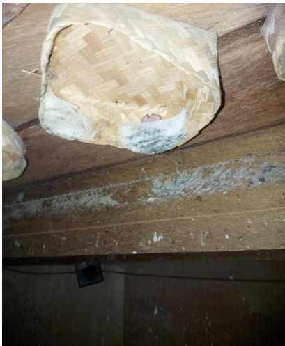
sarang walet yang hinggap di tempat yang disediakan peternak