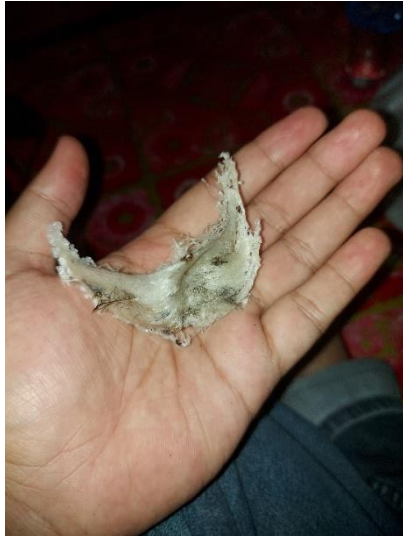
Bentuk sarang walet yang di panen