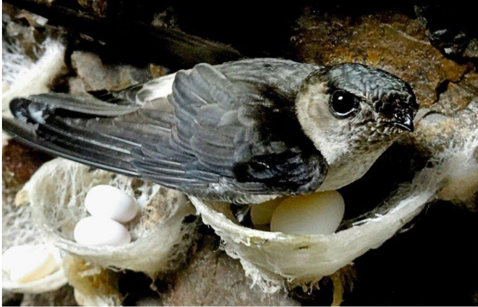
Gambar 2. 1 Walet sarang putih