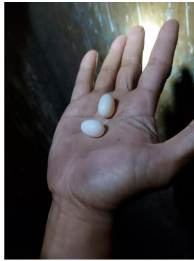
bentuk telur walet dalam sarang walet