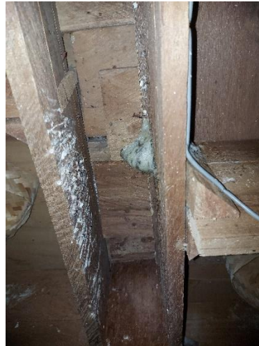
sarang walet yang hinggap di sirip kayu