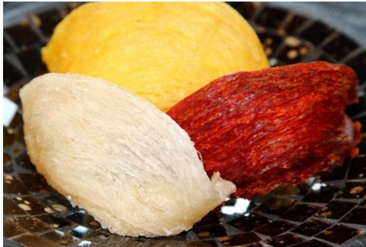
Gambar 2. 2 Jenis-jenis Sarang Walet

Pemanenan sarang walet biasanya dibagi ke dalam 3 tahap yaitu tahap persiapan, pelaksanaan dan pengumpulan serta penimbangan sarang. Perlengkapan yang digunakan antara lain lilin yang terbuat dari sarang lebah (bee's wax), lampu parafin, jala atau matras untuk menadah sarang yang jatuh, tali dan rotan untuk memanjat, serta kantung atau karung. Alat untuk mengunduh sarang berupa galah terbuat dari bambu/kayu yang panjangnya disesuaikan dengan kebutuhan dan dibagian ujungnya dipasangi alat berupa lempengan besi yang diikat dengan rotan (Solihin et al. , 1999).