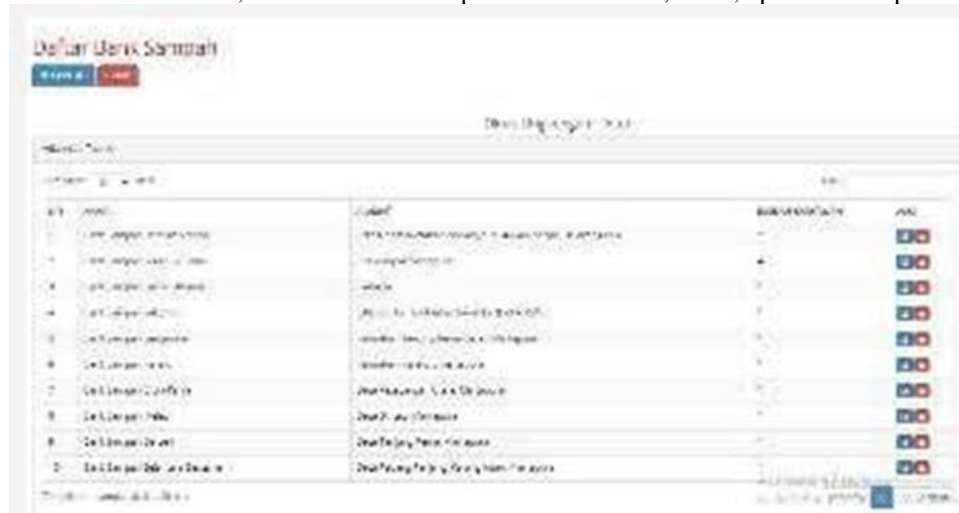
Gambar 5. Tampilan Form Daftar Bank Sampah

Halaman daftar bank sampah adalah halaman yang dipakai dalam suatu proses untuk masuk ke dalam sebuah tabel lain, halaman ini menampilkan tambah data, cetak, update dan hapus.