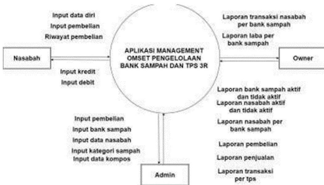
Gambar 2. Diagram Konteks

Rancangan Diagram Konteks pada Aplikasi Pengelolaan Bank Sampah Dan TPS 3R Dinas Lingkungan Hidup di Pemerintah Kabupaten Banjar Berbasis Web adalah sebagai berikut :