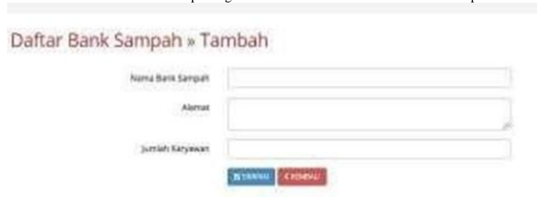
Gambar 8. Tampilan Form Tambah Daftar Bank Sampah

Form tambah daftar bank sampah digunakan untuk menambahkan data bank sampah baru.