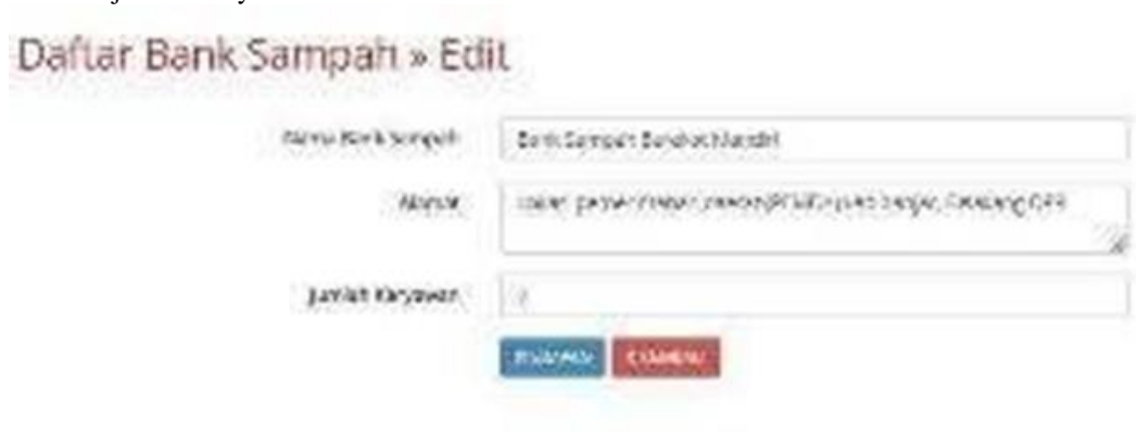
Gambar 6. Tampilan Form Edit Bank Sampah

Menu edit bank sampah digunakan untuk mengubah data bank sampah berupa nama bank sampah, alamat dan jumlah karyawan.