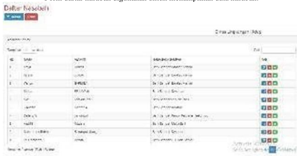
Gambar 9. Tampilan Form Daftar Nasabah

Form daftar nasabah digunakan untuk menampilkan data nasabah.