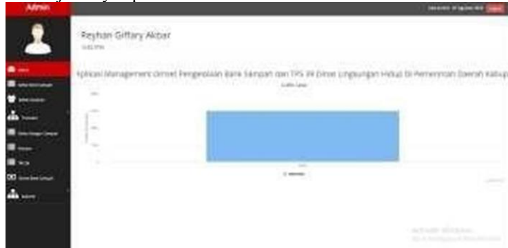
Gambar 4. Tampilan Dashedboard Aplikasi

Halaman ini menampilkan grafik dari pendapatan (laba) perbulan dan terdapat beberapa tabel yang akan membantu berjalannya aplikasi ini.