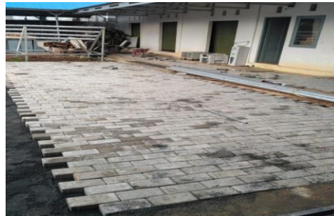
Gambar 2. Contoh Pekerjaan yang dilakukan

Narasumber dalam penelitian berjumlah 6 orang, yang terdiri dari: