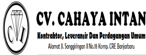
Gambar 1. Logo CV. Cahaya Intan

CV. Cahaya Intan telah didirikan sejak tahun 2003 bertempat di Banjarbaru. Tujuan didirikannya CV. Cahaya Intan bertujuan untuk menjalankan perusahaan yang bergerak di bidang kontraktor bangunan, pengadaan barang dan jasa, serta perindustrian. Melalui kegiatan yang dilakukan ini CV. Cahaya Intan memiliki jumlah tenaga kerja yang bisa dikatakan cukup banyak. Setiap tenaga kerja yang digunakan ini memiliki tugas dan fungsinya masing-masing diantaranya adalah direktur, admin, dan pekerja lapangan.