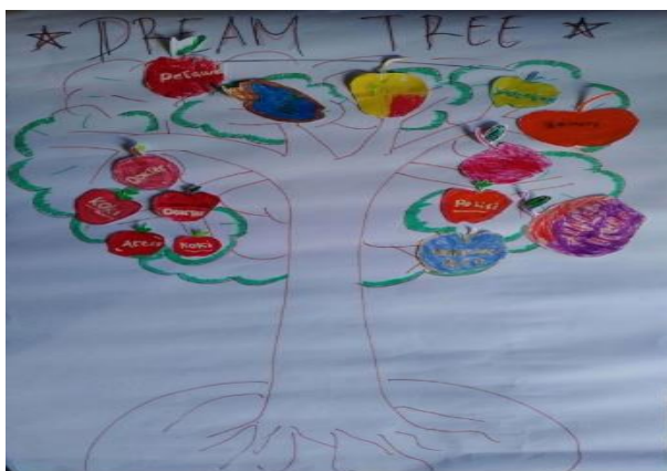
Gambar 4.1 Hasil Kegiatan Anak Jalanan ( Dream Tree )

skor rata-rata 3 dengan berkategori baik. Sedangkan untuk aspek penilaian keaktifan dan psikomotorik anak diperoleh skor rata-rata 3.6 dengan kategori sangat baik. Kegiatan yang dilakukan pada pertemuan ke 1 merupakan kegiatan Character Building dan Self regulated learning dimana kegiatan ini dilaksanakan untuk memberikan pengetahuan dan wawasan kepada anak jalanan tentang analisa strength (kekuatan) dan potensi dalam diri, serta kegiatan untuk membantu anak dalam manajemen waktu. Kegiatan pada pertemuan ke 2 merupakan kegiatan perencanaan pengembangan diri ( Self Planing ). Kegiatan ini memfasilitasi anak jalanan dalam merencanakan kegiatan-kegiatan yang harus mereka lakukan guna mencapai cita-cita yang telah mereka buat sebelumnya pada media dream tree . Adapun cita-cita yang dituliskan oleh anak jalanan dapat dilihat pada gambar dream tree yang dibuat pada kegiatan pertemuan ke 2.