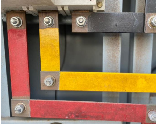
Gambar 4.8. Busbar Fasa