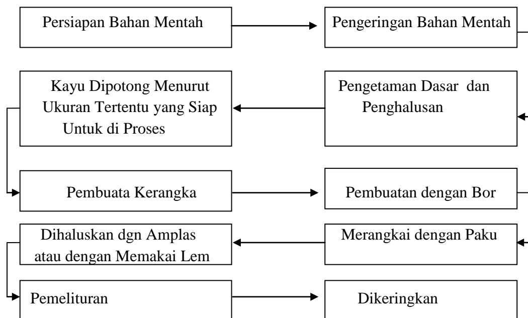
Tabel 1 Proses Produksi / Tahapan Produksi Pada PT Golden Hope Nusantara Kabupaten Kotabaru