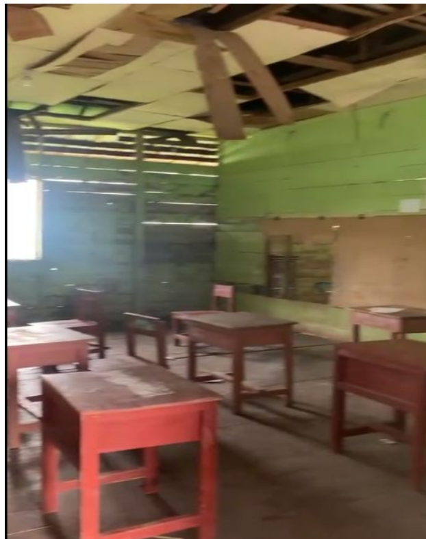
Gambar 1.3. Kondisi Fasilitas Pendidikan Yang Banyak Kerusakan

Kondisi Madrasah Ibtidaiyah Tasrihul Islam Kabupaten Banjar masih cukup memprihatinkan. Gambar 1.3 berikut menampilkan kondisi lokasi pengabdian.