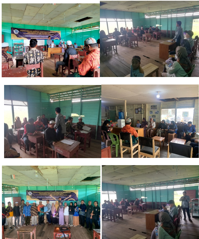
Gambar 4.2 Foto Dokumentasi Pelaksanaan Pelatihan Penyusunan RAB

Pelaksanaan kegiatan pengabdian ini juga melibatkan mahasiswa untuk mendampingi parapeserta pelatihan. Dokumentasi Kegiatan Pelatihan yang adalah sebagai berikut