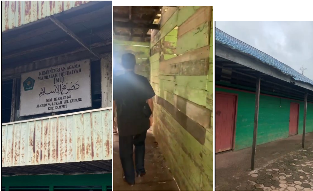
Gambar 4.1. Foto Survei Lokasi Pengabdian