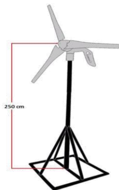
Gambar 3.4 Skema Penginstalan Alat