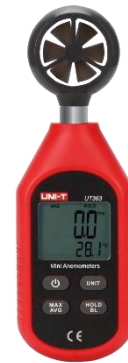
Gambar 3.1 Anemometer digital

Anemometer merupakan sebuah alat yang digunakan untuk mengetahui kecepatan angin, dan juga untuk mengetahui berapa tekanan udara.