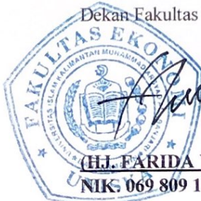
(H.J. FARIDA YULIANTI, SE, MM)