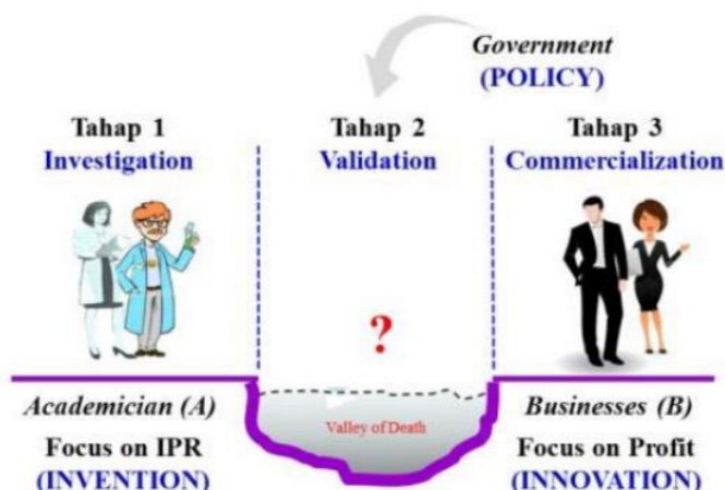
Gambar 1.3. Hubungan Faktor ABG dengan Hilirisasi Produk

Proses hilirisasi teknologi secara garis besar terdiri dari 3 tahap, yaitu, investigasi, tahap pengembangan (validasi), dan tahap komersialisasi. Tahap ke-1 adalah tahap penciptaan gagasan/ide yang berbentuk invensi. Sedangkan tahap ke-2 yaitu tahap lembah kematian ( valley of death ), dan tahap ke-3 adalah tahap inovasi yang dilakukan oleh praktisi yang akan memasarkan dan berhubungan langsung dengan konsumennya. Tapap ke-2 sesuai dengan istilahnya, disebut sebagai tahap yang paling sulit dilewati, hal ini banyak disebabkan oleh adanya ego antara akademisi dan praktisi, di mana akademisi mementingkan HKI, sementara itu praktisi lebih mementingkan pada keuntungan finansial yang besar.