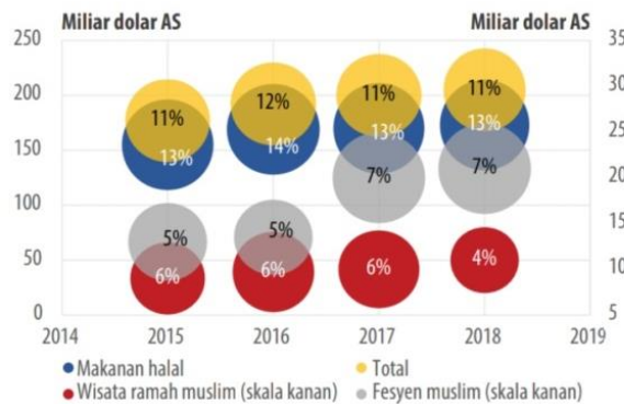
Gambar 2. Pangsa Pasar Syariah Indonesia terhadap Syariah Global 2018

Perkembangan ekonomi syariah di Indonesia menunjukkan kontribusi yang terus meningkat pada tataran global, sehingga pengembangan ekonomi syariah berperan penting dalam transformasi ekonomi menuju Indonesia Maju. Potensi besar Indonesia terlihat dari nilai sektoral industri halal ini yang terus meningkat, dengan pangsa mencapai sekitar 11% dari pasar global, disumbang industri makanan halal, fesyen, dan wisata halal/ramah muslim.