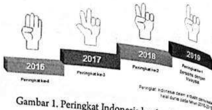
Gambar 1. Peringkat Indonesia berdasarkan GMTI (Mastercard-Crescentrating, 2019)

Dalam upaya meningkatkan pariwisata halal di Indonesia, pemerintah melalui Kementerian Pariwisata Republik Indonesia telah menetapkan 13 provinsi sebagai calon destinasi wisata halal pada tahun 2015. Provinsi tersebut meliputi Nusa Tenggara Barat, Nanggroe Aceh Darussalam, Sumatera Barat, Riau, Lampung, Banten, DKI Jakarta, Jawa Barat, Jawa Tengah, DI Yogyakarta, Jawa Timur, Sulawesi Selatan, dan Bali (Ardianto, 2015). Sayangnya, Provinsi Kalimantan Selatan tidak termasuk dalam daftar di atas. Kementerian Pariwisata juga tidak memasukkan provinsi ini ke dalam 18 destinasi pariwisata favorit Indonesia pada tahun 2018 (Prokalsel, 2017). Nampaknya, provinsi Kalimantan Selatan dipandang masih belum menunjukkan komitmen yang serius dan belum memiliki kesiapan yang diperlukan untuk mengembangkan pariwisata halal dibandingkan provinsi-provinsi lainnya di tanah air.