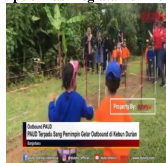
Gambar 4 publikasi kegiatan di media televisive

Untuk mengenalkan sekolah dimata masyarakat luas Paud Terpadu Sang Pemimpin bekerja sama dengan duta tv dalam mempublikasikan kegiatan dan event yang dilaksanakan. Kegiatan dan event yang sudah dipublikasikan mencakup kegiatan outbond,acara perpisahan, perayaan hari ibu dan hari kartini. Tujuan pulisitas sekolah agar nama dan kegiatan yang ada di sekolah dapat dikenal oleh masyarakat luas.