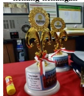
Gambar 2 Bentuk promosi penjualan Paud Terpadu Sang Pemimpin dalam bentuk pemberian cendramata hadiah kenang-kenangan

“ Ada memberikan kenang-kenangan berupa cendramata saat akhir semester kalau dulu kami beri baki, kipas tangan untuk tahun ini kami memberikan piala saja. “(HJ.Bastiah,kepala sekolah)