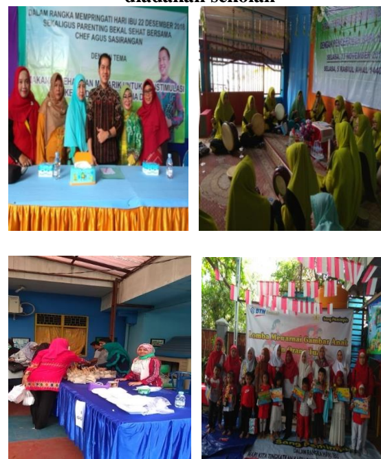
Gambar 6 event dan pertemuan yang diadakan sekolah

Tujuan pertemuan dan event dilakukan untuk mempererat hubungan silaturahmi pihak sekolah dengan orang tua dan masyarakat sekitar, dan juga untuk merangsang pemasaran mulut ke mulut oleh orang tua murid dan masyarakat yang diundang yang menceritakan tentang program, sarana prasarana dan kegiatan yang dilaksanakan oleh sekolah kepada orang-orang terdekatnya sehingga menjadi pemacu bagi orang yang mendengar hal tersebut untuk memasukan anaknya di Paud Terpadu Sang Pemimpin.