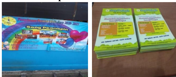
Gambar 1 spanduk dan brosur sekolah

“Kebetulan kita jalan cari cari sendiri yang mana dekat kantor gitu, jadi kemaren itu kita lihat itukan didepan sekolah ada banner disitu kita lihat fasilitasnya apa aja jadi langsung aja kesini.” (ibu Nadya, orang tua murid )