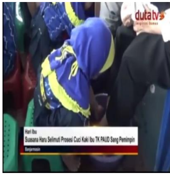
Gambar 5 publikasi kegiatan di berita online