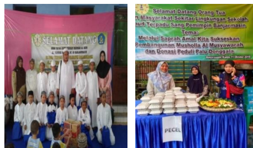
Gambar 3 kegiatan kehumasan dilakukan sekolah

Sedangkan publicitas yaitu kegiatan menempatkan berita mengenai seseorang, organisasi, atau perusahaan dimedia massa. ( Morissan, 2010:29)