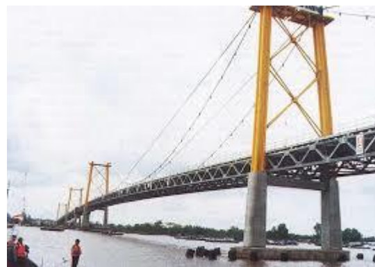
Gambar 1.1 Jembatan Komposit

Jembatan komposit adalah jembatan yang memiliki pelat lantai beton dihubungkan dengan girder atau gelagar baja yang bekerja sama mendukung beban sebagai satu kesatuan balok. Gelagar baja terutama menahan tarik sedangkan plat beton menahan momen lendutan.