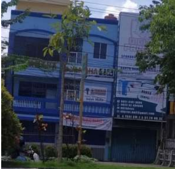
Gambar 1. Bangunan Ruko Yamaha

Untuk lebih jelasnya bisa dilihat pada gambar dibawah ini kondisi pada saat bangunan miring.