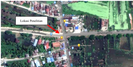
Gambar 1. Lokasi Pengamatan

Pengamatan ini terletak di persimpangan Jalan Gerilya-Jalan Lingkar Dalam Selatan Kota Banjarmasin.