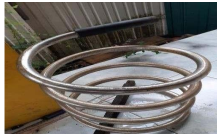
Gambar kondensor tipe I dengan ukuran diameter 30.5 cm