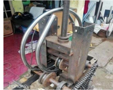
Gambar Mal Besi