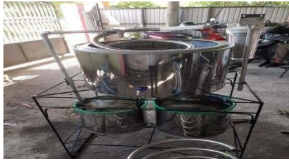
Gambar Alat reaktor destilasi oli bekas