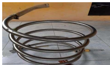
Gambar kondensor tipe II dengan ukuran 36 cm