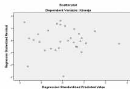
Gambar 4.3 Hasil Uji Heteroskedastisitas

Uji Heteroskedastisitas digunakan untuk Uji Heteroskedastisitas digunakan untuk menguji apakah dalam model regresi linier kesalahan pengganggu mempunyai varians yang sama atau tidak dari satu pengamatan ke pengamatan lainnya. Uji Heterokedastisitas biasa juga disebut uji homogenitas. Uji ini dapat juga dilihat dari plot datanya atau pada tabel scatterplot