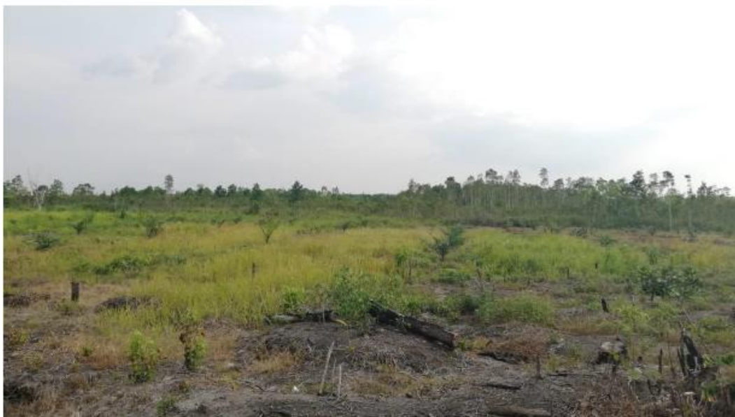
Gambar2 Keadaan Alam Desa Mantangai

Berdasarkan hasil beberapa wawancara diatas, maka peneliti dapat menyimpulkan bahwa meningkatnya perekonomian atau tingkat kesejahteraan akibat budidaya sarang walet di Desa Mantangai Hilir sampai saat ini belum meningkatkan religiusitas pengusaha sarang walet, hal ini disebabkan oleh uang yang seharusnya digunakan untuk membayar zakat digunakan untuk membayar angsuran di Bank, belum ada petugas Zakat yang memberi informasi atau sosialisasi tentang pentingnya bayar Zakat, belum meningkatnya Religiusitas Masyarakat karena memang budaya dan kondisi di Desa Mantangai Hilir menurut sejarahnya merupakan bekas penganut Hindu Kaharingan yang masuk Islam namun suasana religiusitas belum terbangun akibat kurangnya ahli agama Islam maupun pendakwah yang datang karena akses jalan yang cukup sulit untuk ditempuh melalui jalan Darat, sehingga dengan kurangnya pengetahuan agama maka keharmonisan antara warga dan upaya untuk menjaga kelestarian lingkungan yang pada dasarnya merupakan prinsip agama Islam belum dapat diwujudkan dengan baik.