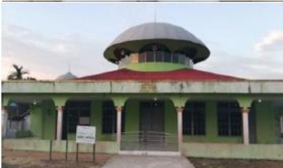
Gambar 2 Masjid tempat Ibadah Warga Desa Mantangai Hilir

pencucian yang benar-benar bersih halal hukumnya sehingga dapat disimpulkan bahwa bahan dari sarang burung walet adalah halal namun bisa menjadi haram jika sarang burung tersebut tercampur dengan kotoran.