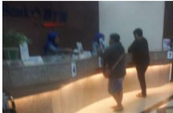
(Gambar Pelayanan penyetoran tabungan maupun penarikan uang)

Pada saat penyetoran tabungan maupun penarikan uang, resiko yang bisa terjadi adalah :