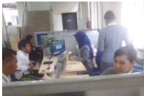
(Gambar Pelayanan pembukaan rekening)

Pada saat pembukaan rekening, resiko yang bisa terjadi adalah :