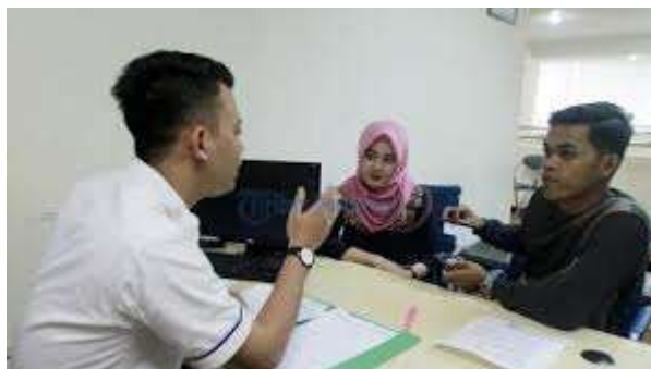
(Gambar 4.2.7 : Pelayanan pengajuan kredit)