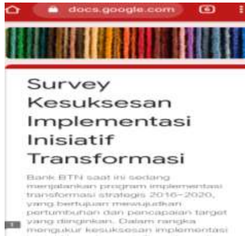
(Gambar Contoh Survey Penilaian Kecakapan Pegawai)

pegawai di dalam bekerja di lingkungan perusahaan maupun instansi. Baik berupa pengetahuan dalam bekerja, pemahaman dalam bidang pekerjaan tersebut, mempunyai kemampuan, memiliki nilai yang sesuai kriteria perusahaan, serta memiliki sikap yang baik dan minat yang tinggi untuk perusahaan.