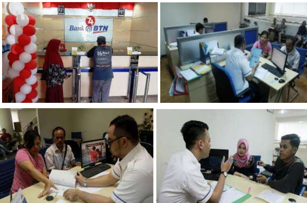
(Gambar Kegiatan Pelayanan Perbankan)

Hasilnya berupa pelayanan yang terbaik untuk nasabah, sehingga nasabah menjadi puas dalam melakukan transaksi keuangan dan kredit di Bank Tabungan Negara.