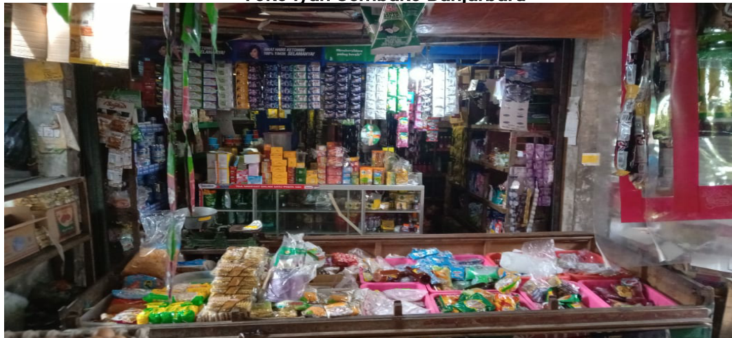
Gambar 2 Tampak Depan Toko ke-1 Toko Iyah Sembako Banjarbaru

Berikut adalah gambar pasar dari Toko Iyah Sembako Banjarbaru: