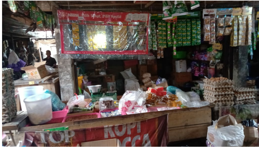
Gambar 3 Tampak Depan Toko ke-2 Toko Iyah Sembako Banjarbaru