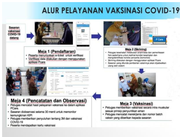
Gambar 7. Alur Pelayanan Vaksinasi Covid-19

Fasilitas pelayanan Kesehatan yang tidak dapat memenuhi persyaratan poin 2 dapat menjadi tempat pelayanan vaksinasi COVID-19 namun dikoordinasi oleh puskesmas setempat. Adapun alur pelayanan saat Melaksanakan Vaksinasi sebagai berikut