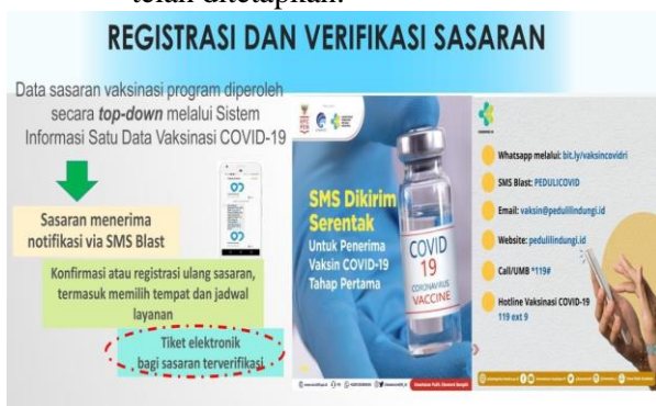
Gambar 6. Registrasi dan Sasaran Vaksinasi

Melalui Sistem Informasi Satu Data Vaksinasi COVID-19 dilakukan penyaringan data ( filtering ) sehingga diperoleh sasaran kelompok penerima vaksin COVID-19 sesuai kriteria yang telah ditetapkan.