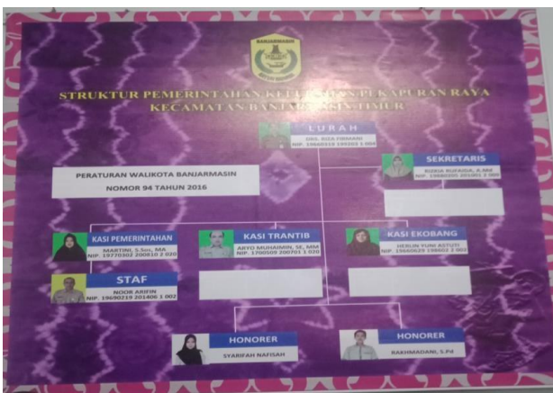
Gambar 5. Struktur Organisasi Kantor Kelurahan Pekapuran Raya Kota

Berikut ini struktur birokrasi yang ada di Kelurahan Pekapuran Raya Kota Banjarmasin