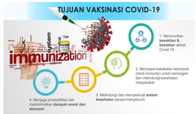
Gambar 3. Tujuan Vaksinasi Covid-19

Dengan diperkuatnya imunitas masyarakat kelurahan Pekapuran Raya, produktivitas juga akan meningkat sehingga meminimalkan dampak ekonomi dan sosial yang selama ini menjadi salah satu isu utama pandemi COVID-19 disamping kesakitan dan kematian, sebagaimana sesuai dengan tujuan dari Vaksinasi Covid-19 yaitu: