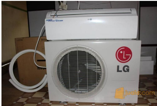
Gambar 3.1 Instalasi AC Split LG 1 PK

conditioner (AC) LG jenis Split 1Pk dengan pemanasan lanjut dan pendinginan lanjut dengan suhu 19°C dengan nilai yang berbeda-beda.