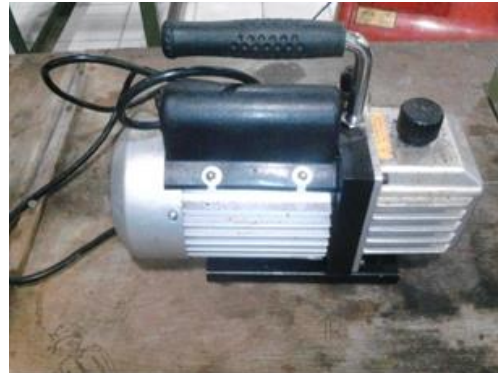
Gambar 3.2 Pompa Vakum