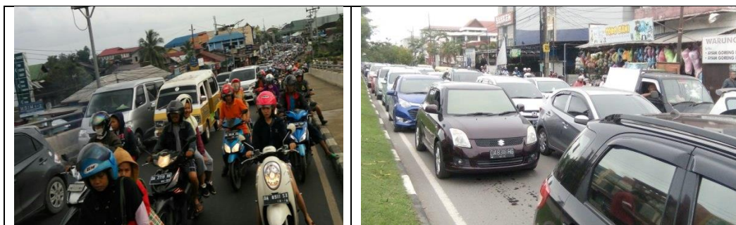
Gambar 1. Ruas Jalan Brigjen H. Hasan Basri

Jalan Brigjen H. Hasan Basri terletak di Kota Banjarmasin tepat Kecamatan Banjarmasin Utara merupakan jenis jalan kolektor primer, kepemilikannya merupakan jalan Nasional yang melayani angkutan kendaraan kelas berat, sedang dan ringan. Dan satu-satunya jalan poros yang menghubungkan ke luar kota yang menghubungkan Kota Banjarmasin ke Kabupaten Batola dan Kalimantan Tengah. Mengingat pentingnya peran dan fungsi ruas jalan Brigjen H. Hasan Basri maka di ruas jalan ini perlu diadakan analisis kapasitas dan tingkat pelayanan jalan. Hasil analisis akan memberikan gambaran apakah ruas jalan ini masih memadai atau memerlukan peningkatan seperti pelebaran jalan atau perubahan rekayasa lalu lintas. Menurut RTRK Kota Banjarmasin, Banjarmasin Utara merupakan kawasan perkantoran dan pendidikan sepanjang Jalan Brigjen H. Hasan Basri serta kawasan ibadah dan kesehatan bercampur pemukiman.