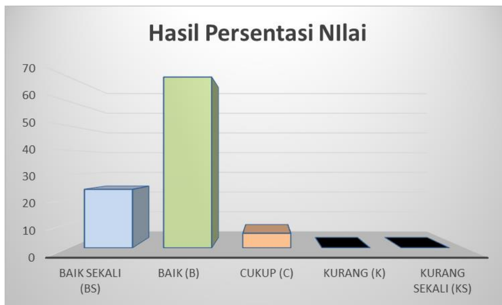
Gambar 4.1 Diagram histogram hasil secara keseluruhan nilai prestasi belajar Peserta didik SDN Bantuil 1 Banjarmasin

Berikut digambarkan dalam bentuk diagram histogram berdasarkan jumlah peserta didik rata-rata nilai pendidikan jasmani peserta didik SDN Bantuil 1 Banjarmasin .