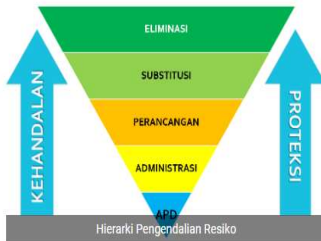
Gambar 1 Hierarki Peendalian Risiko

Penilaian tahap in tujuannya yaitu buat mengetahui seberapa besar penurunan risiko terhadap bahaya setelah dilakukakn pengendalian risiko mennggunakan HIRAC. Pengendalian yang dilakukan pada penelitian ini bisa dilihat pada gambar 4.2 berikut.