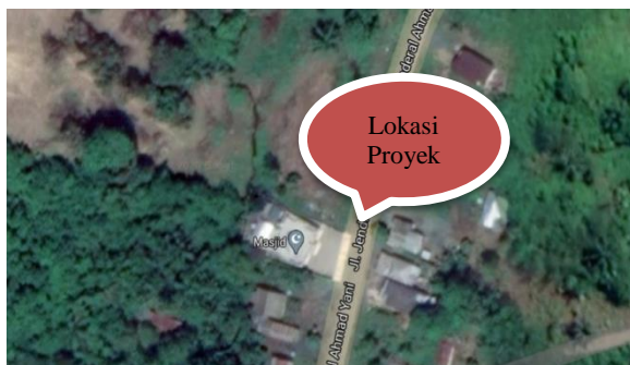
Gambar 3.1 Lokasi Penelitian

Lokasi tempat melakukan penelitian adalah Penggantian Jembatan Sungai Hanau Cs beradadidaerah Jl. Jendral Ahmad Yani, Gunung Besar Kec. Simpang Empat, Kabupaten Tanah Bumbu, Kalimantan Selatan 72271. Waktu penelitian disesuaikan dengan kalender akademik Universitas Islam Kalimantan Muhammad Arsyad Al Banjari.