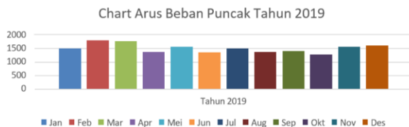
Gambar 2. Grafik beban puncak tahun 2019

Pada penelitian ini dilakukan pengambilan data beban puncak pada feeder Gardu Induk 70 kV Ulin tahun 2019 dan 2020. Adapun grafik beban puncak Gardu Induk 70 kV ulin adalah sebagai berikut.