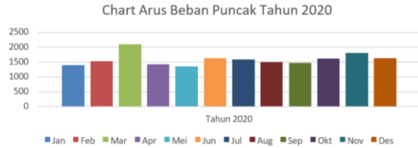
Gambar 3. Grafik beban puncak tahun 2020

Dari data yang terlihat dalam chart arus beban puncak pada kisaran tahun 2019 – 2020, didapatkan bahwa jumlah arus beban puncak tertinggi pada tahun 2019 terjadi pada Bulan Februari dan jumlah arus beban puncak tertinggi pada tahun 2020 terjadi pada Bulan Maret. Arus pada saat beban puncak pada Bulan Februari tahun 2019 dan Maret 2020 terjadi pada pukul 19.00 – 21.00 WITA dikarenakan banyaknya pemakaian listrik yang digunakan oleh pelanggan pada jam-jam tersebut. Setelah mendapatkan nilai tertinggi dari arus beban puncak masing-masing tahun, dilakukan perhitungan konstanta dan koefisien (a dan b) fungsi regresi linier sederhana menggunakan persamaan (2.3), yaitu: