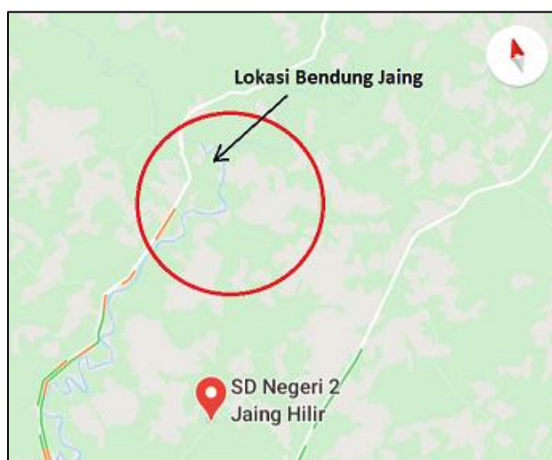
Gambar 3.1. Lokasi Penelitian

Penelitian ini dilaksanakan di Kabupaten Tabalong Desa Jaing berjarak 87 km dari Ibu Kota Kabupaten Tabalong Tanjung, adapun denahnya adalah sebagai berikut: