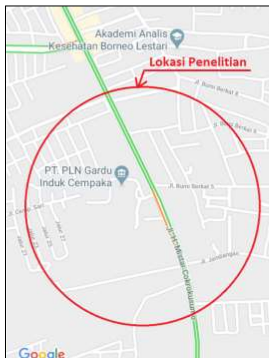
Gambar 1 Peta Lokasi Penelitian

Penelitian ini menggunakan cara metode evaluasi/pengamatan lapangan dengan sistematika. Penelitian ini dilaksanakan di kota Banjarbaru – Simpang Tiga Bati-Bati, peta lokasi seperti pada gambar berikut: