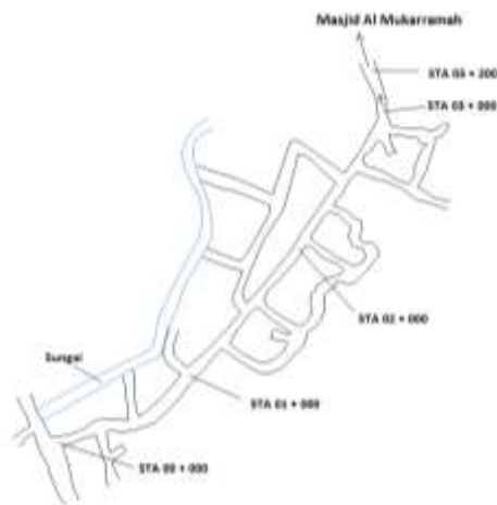
Gambar 3.1 Peta Denah Jalan Yang Akan Diteliti

Penelitian ini dilaksanakan di ruas jalan di Kota Rantau.