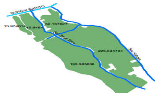
Gambar 4.2 Saluran Irigasi desa Sinar Baru