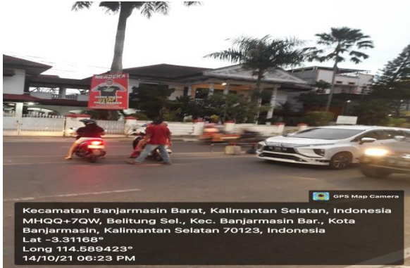
Gambar 3 pengaruh kecepatan terhadap adanya U-turn

Pengaruh kecepatan kendaraan dengan adanya u-turn pada jalan S. Parman kota Banjarmasin.