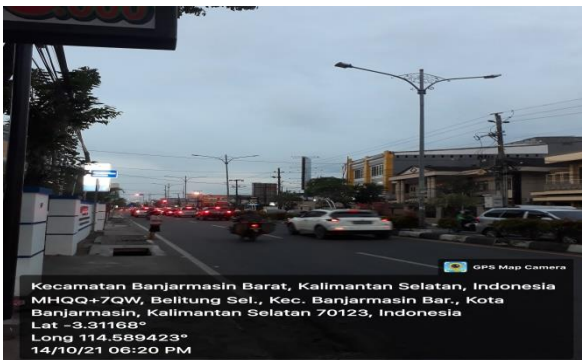
Gambar 4 Pengaruh kecepatan terhadap adanya rambu lalu lintas

Pengaruh kecepatan kendaraan pada saat lampu merah ke arah simpang empat Belitung pada jalan S. Parman Kota Banjarmasin.