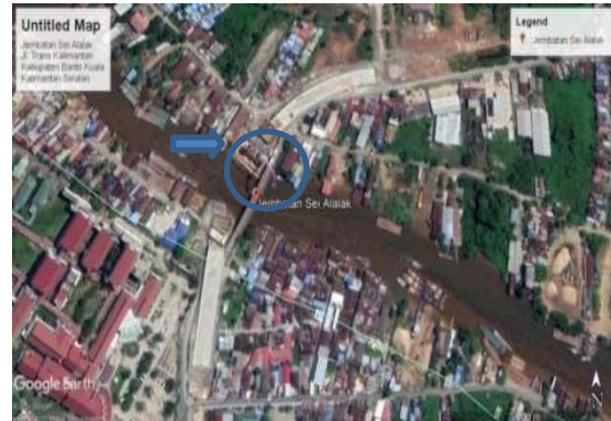
Gambar 1. Lokasi Penelitian

Lokasi : Jl.Trans Kalimantan Proyek No.73, Berangas Tim., Kec.Alalak,Kabupaten Barito Kuala, Kalimantan Selatan