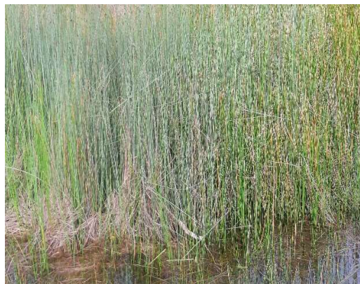
Gambar 1. Tanaman hijauan rawa Purun Tikus ( Heleocharis dulcis Burm) di Kabupaten Barito Kuala

Hasil pengamatan Fariani et al., (2008), menunjukkan bahwa lahan rawa lebak ditumbuhi vegetasi tumbuhan yang cukup beragam dengan 12 ragam spesies tumbuhan, 7 diantaranya diklasifikasikan sebagai rumput. Komposisi botani yang ada di rawa, dapat menjadi sumber hijauan pakan ternak, walaupun tidak semua tumbuhan disukai ternak. Ternak akan memilih yang disukai dan tidak mengandung racun. Bucio et al., (2005) menyatakan bahwa kestabilan komunitas tanaman dipengaruhi oleh lingkungan biotik (ternak) dan abiotik (air, tanah dan iklim), sehingga tanaman yang tidak bisa tumbuh pada keadaan tersebut maka spesies lain menggantikan.