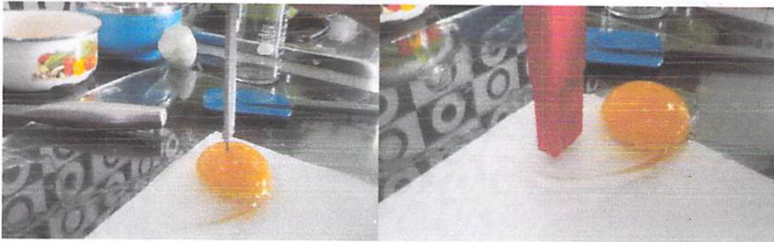
Gambar 4. Pengukuran warna, tinggi yolk dan pH putih telur