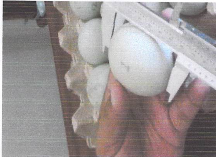
Gambar 3. Pengukuran panjang Telur

baik jika tekstur kulitnya halus dan keadaan kulit telurnya utuh serta tidak retak. Bentuk telur yang baik adalah proporsional, tidak berbenjol-benjol, tidak terlalu lonjong dan juga tidak terlalu bulat.