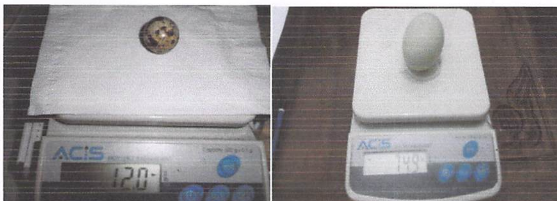
Gambar 2. Penimbangan bobot telur puyuh dan itik

Menurut Sarwono (1994), kualitas bagian luar meliputi bentuk warna, warna kulit telur, tekstur permukaan kulit telur, berat telur dan kebersihan kulit telur Berdasarkan hasil pengamatan dan pengukuran diperoleh hasil seperti yang disajikan pada table 4.1. Dilihat dari bobot telur ternyata rata rata bobot telur itik lebih berat dibandingkan dengan telur ayam ras petelur. Berdasarkan hasil pengamatan dan pengukuran diperoleh hasil seperti yang disajikan pada tabel 4.1. Dilihat dari bobot telur ternyata rata rata bobot telur itik lebih berat dibandingkan dengan telur ayam ras petelur, ayam buras maupun telur puyuh.