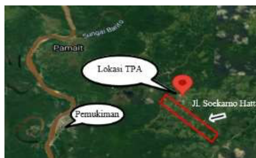
Gambar 3.1 Lokasi Penelitian

Penelitian ini dilakukan dengan mengambil kasus perencanaan proyek pembangunan garasi TPA Tabak Kanilan Desa Sababilah Kabupaten Barito Selatan Buntok Kalimantan Tengah.