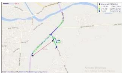
Gambar 8. Hasil pengukuran pada sektor 3 untuk FDD

Sedangkan pada sektor terakhir dengan azimuth 240 derajat didapatkan jangkauan coverage area sebesar 872.1 meter dengan bandwidth pada cell tersebut sebesar 15 MHz. Hasil pengukuran dapat dilihat pada gambar 8.