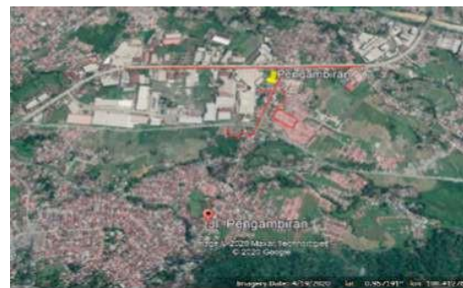
Gambar 2 Tampilan jalur drivetest

Sehubungan dalam menentukan wilayah dapat dilihat dari data MKOM operator Telkomsel cluster Kota Padang. Jadi wilayah yang ditentukan adalah pada daerah Arai Pinang Pegambiran. Penulis menggunakan aplikasi googleearth sebagai pendukung keberadaan permukiman pada wilayah tersebut. Berikut tampilan jalur drivetest yang ditunjukkan dengan garis warna merah pada gambar 2.