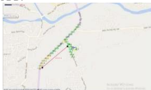
Gambar 11 Hasil pengukuran pada sektor 3 untuk TDD

Sedangkan pada sektor terakhir dengan azimuth 240 derajat didapatkan jangkauan coverage area sebesar 922.8 meter dengan bandwidth pada cell tersebut sebesar 20 MHz. Hasil pengukuran dapat dilihat pada gambar 11. Pada hasil pengukuran tersebut dapat dilihat jangkauan coverage area terjauh didapatkan pada teknologi FDD.