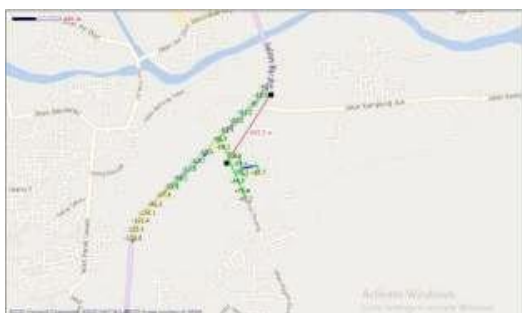
Gambar 9 Hasil pengukuran pada sektor 1 untuk TDD

Sedangkan pada teknologi TDD untuk level penerimaan daya yang didapatkan pada hasil drivetest. Untuk sektor awal yaitu 0 derajat didapatkan jangkauan coverage area sebesar 663.3 meter dengan bandwidth pada cell tersebut sebesar 20 MHz. Hasil pengukuran dapat dilihat pada gambar 9.