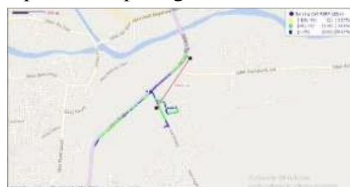
Gambar 6. Hasil pengukuran pada sektor 1 untuk FDD

Untuk membandingkan jangkauan coverage area dilihat dari level penerimaan daya terjauh dari tiap-tiap sektor. Pada teknologi FDD untuk coverage area yang didapatkan pada hasil drivetest. Untuk sektor awal yaitu 0 derajat didapatkan jangkauan coverage area sebesar 789.1 meter dengan bandwidth pada cell tersebut sebesar 15 MHz. Hasil pengukuran dapat dilihat pada gambar 6.