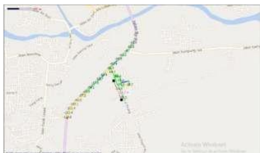
Gambar 10 Hasil pengukuran pada sektor 2 untuk TDD

Sedangkan pada sektor 2 dengan azimuth 120 derajat didapatkan jangkauan coverage area sebesar 338.7 meter dengan bandwidth pada cell tersebut sebesar 20 MHz. Hasil pengukuran dapat dilihat pada gambar 10.