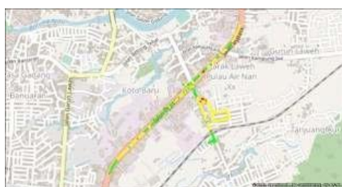
Gambar 4. Tampilan hasil drivetest RSRQ Telkomsel FDD