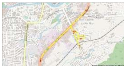
Gambar 5. Tampilan hasil drivetest RSRQ Telkomsel TDD

Gambar 4 tampak kualitas sinyal kualitas dari sinyal yang diterima operator Telkomsel pada teknologi FDD berdasarkan KPI memiliki kualitas yang baik karena didominasi oleh indikator green dan yellow , yang memiliki nilai yang berkisar Min hingga -3 dB. Kemudian untuk indikator yellow memiliki nilai berkisar -14 dB hingga -9 dB. Hal ini tampak pada hasil plotting drivetest dan legend (indikator warna KPI). Sedangkan untuk teknologi TDD hasil plotting logfile dapat dilihat pada