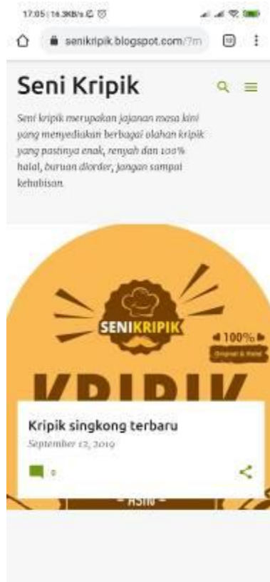
Gambar 7. Sosial Media Website

semakin luas, karena tidak hanya konsumen terdekat saja yang bisa menikmati produk tersebut, namun konsumen yang jauh pun dapat menikmati produk yang sama. Oleh karena itu, dibuatlah media sosial guna untuk memasarkan produk seni kripik agar pemasarannya lebih luas lagi. Hal ini juga bertujuan untuk meningkatkan proses penjualan yang tadinya hanya sebatas satu kota saja, menjadi lebih luas lagi. Konsumen pun dapat memesan produk seni kripik secara online, tidak perlu lagi menuju ke tempat penjualan dari produk seni kripik.