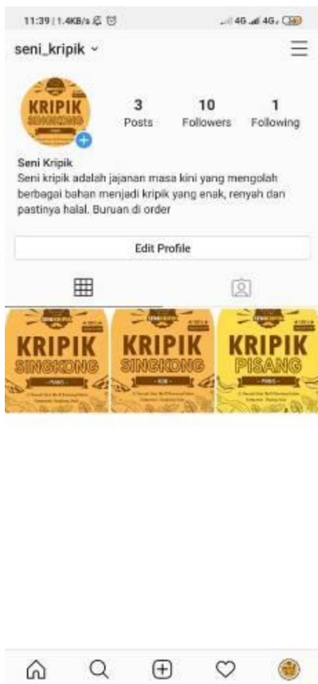
Gambar 6. Sosial Media Instagram