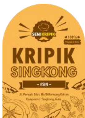
Gambar 2. Desain Label Keripik Singkong Asin