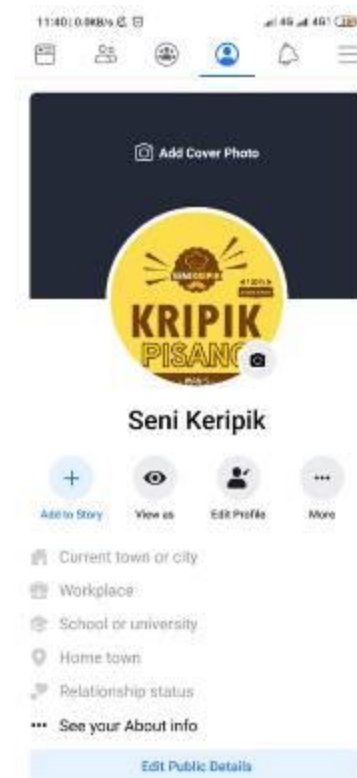
Gambar 8. Sosial Media Facebook