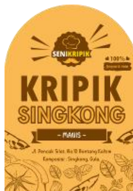
Gambar 3. Desain Label Keripik Singkong Manis