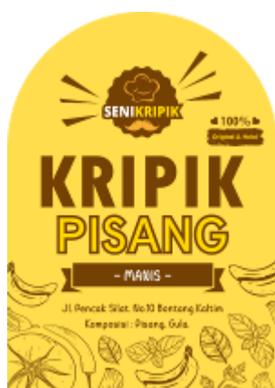
Gambar 1. Desain Label Keripik Pisang Manis

Desain logo ini ditujukan untuk meningkatkan minat dari pembelian dari produk seni kripik. Desain logo ini juga akan menjadi ciri khas dari seni kripik agar lebih dikenal oleh masyarakat. Untuk saat ini seni kripik memproduksi 3 macam produk, yaitu kripik singkong manis, kripik singkong asin, serta kripik pisang manis. Jadi dibuatkan 3 buah desain untuk masing masing produk. Untuk desain logo dapat dilihat pada gambar dibawah ini.