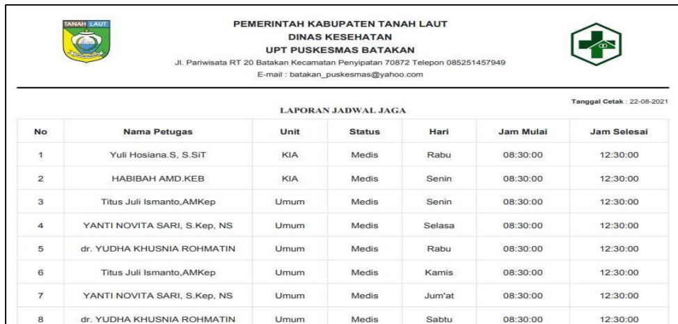
Gambar 8. Tampilan Laporan Jadwal Jaga