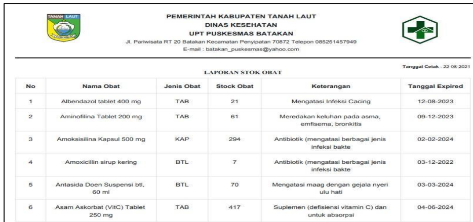
Gambar 6. Tampilan Laporan Stok Obat