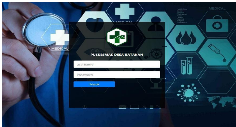
Gambar 1. Tampilan Form Login

Tampilan ini dibuat berdasarkan rancangan form login yang telah dibuat berfungsi untuk mengatur atau membatasi pengguna yang bisa mengakses sistem sesuai dengan hak akses. Tampilan form login pada sistem ini adalah sebagai berikut: