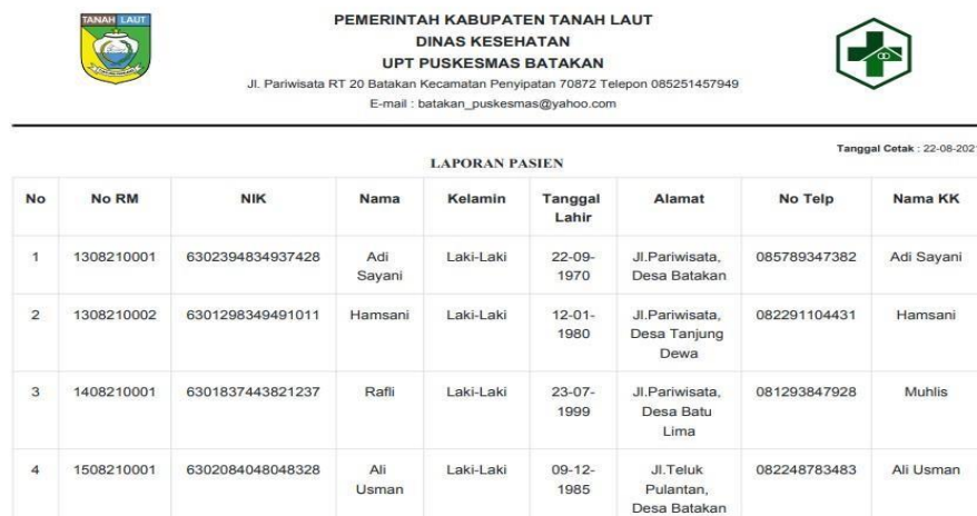
Gambar 7. Tampilan Laporan Pasien

Tampilan laporan pasien adalah tampilan laporan yang berisi data profil pasien, seperti nomor rekam medik, nama, jenis kelamin, tempat dan tanggal lahir pasien. Tampilan ini sebagai berikut: