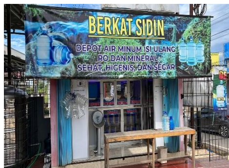
Gambar 2. Depot Air Isi Ulang Ulang (Berkat Sidin)

Promosi yang dilakukan Air Galon Isi Ulang Pada (Berkat Sidin) ini adalah melalui social, radio, brosur dan mulut ke mulut. Tujuan utama promosi adalah memberikan informasi, menarik perhatian dan selanjutnya memberi pengaruh meningkatkan penjualan. Suatu kegiatan promosi jika dilaksanakan dengan baik dapat mempengaruhi konsumen mengenai dimana dan bagaimana konsumen membelanjakan pendapatnya.