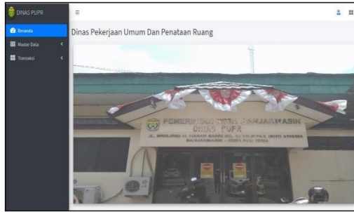
Gambar 2. Halaman Menu Admin