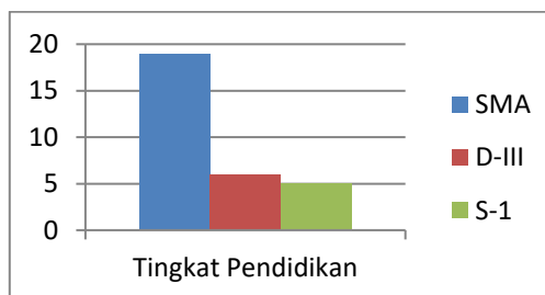
Gambar 2. Tingkat Pendidikan

Berdasarkan tabel diatas dapat dilihat bahwa jumlah responden paling banyak adalah berusia antara 20-30 Tahun sebanyak 16 karyawan (53%), diikuti responden dengan usia antara 31-40 Tahun sebanyak 8 karyawan (27%), lalu responden dengan usia < 20 Tahun sebanyak 6 karyawan (20%).