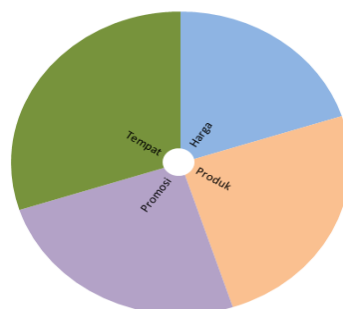
Bagan 4.1 Bauran Pemasaran