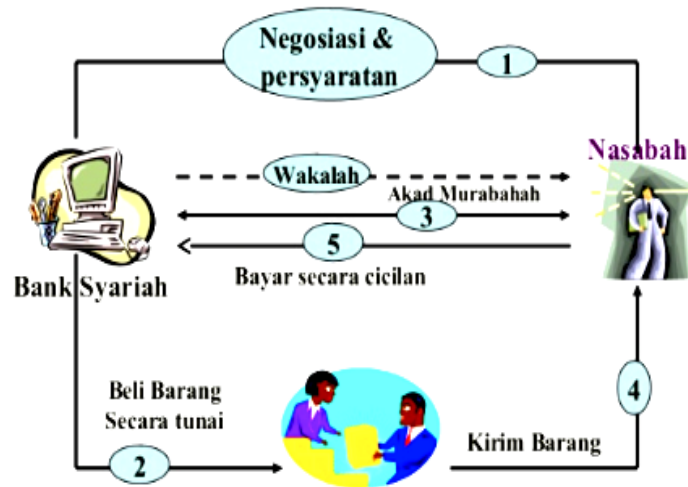
Tabel 2. Skema Murabahah pada Perbankan