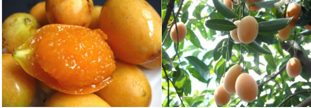
Gambar 4. Buah ramania