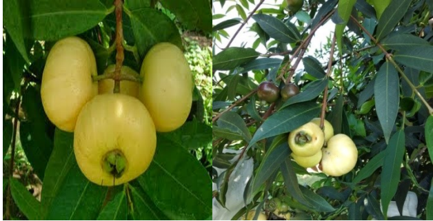
Gambar 3. Jambu mawar