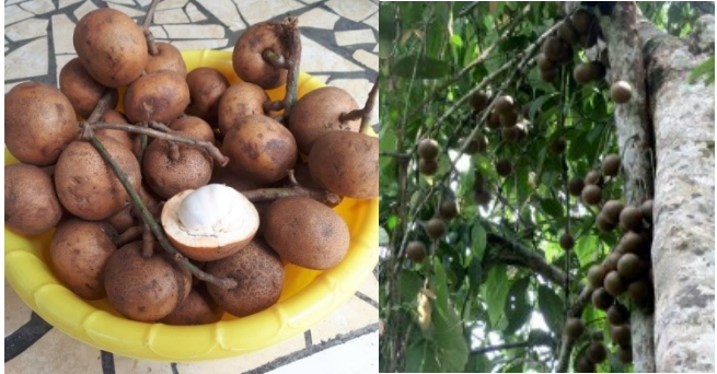
Gambar 2. Batang, daun dan buah Kapul