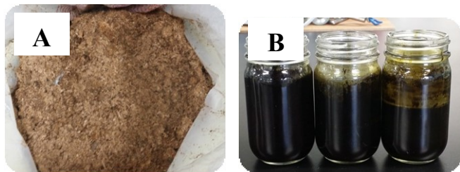
Gambar 6. (A) sampel kering dan halus, (B) ekstrak metanol

Sebanyak 1 Kg sampel yaitu kapul ( Baccaurea macrocarpa ), jambu mawar ( Syzygium jambos ), ramania ( Bouea macrophylla griff) dan mentega ( Diospyros discolor willd) dikeringanginkan pada suhu kamar dengan tujuan untuk mengurangi kadar air sampel, selanjutnya sampel dihaluskan (Gambar 6A), penghalusan sampel tersebut bertujuan agar proses ekstraksi berjalan dengan optimal.