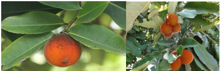
Gambar 5. Buah mentega

dapat dengan mudah ditemukan. Di pasar terapung Banjarmasin, buah mentega diperjualbelikan dengan kisaran harga Rp 2.000,00 perbijinya. Di daerah pedalaman Kalimantan Selatan, tidak banyak yang mengonsumsi buah mentega dengan alasan rasanya yang sepat, meskipun aromanya disukai (Puspita et al, 2017)